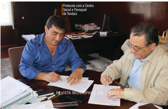
Protocolo com o Centro Social e Paroquial de Tendais