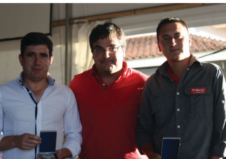
Equipa vencedora do X Torneio de Sueca promovido pelo Município

Os dias 16 a 20 de julho foram dedicados à primeira edição da ExpoMontemuro. Uma das atividades que permaneceu neste evento foi o Torneio de Sueca que cumpriu este ano a 10ª edição.