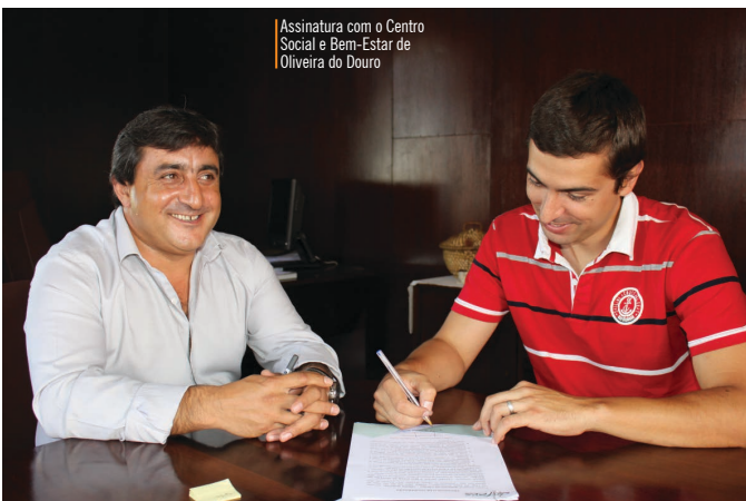
Assinatura com o Centro Social e Bem-Estar de Oliveira do Douro