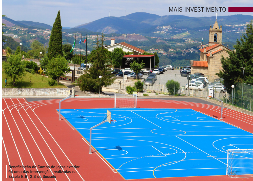
Beneficiação do Campo de jogos exterior foi uma das intervenções realizadas na Escola E.B. 2,3 de Souselo

As empreitadas de manutenção e beneficiação da Escola E.B. 2,3 de Souselo e da Escola Secundária de Cinfães foram financiadas em 85% pelo Fundo Europeu de Desenvolvimento Regional.