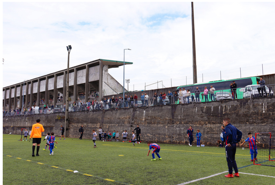
■ Encontro de Traquinas e Petizes em Cinfães

Cinfães - Município Amigo do Desporto foi o palco escolhido, no dia 27 de maio, para a realização do Encontro de Traquinas e Petizes (Sub9 e Sub7) da Associação de Futebol de Viseu. Uma organização do Clube Desportivo de Cinfães, com o apoio do Município de Cinfães e que contou com a participação de aproximadamente 250 atletas, de 29 equipas, em representação de 10 clubes filiados.