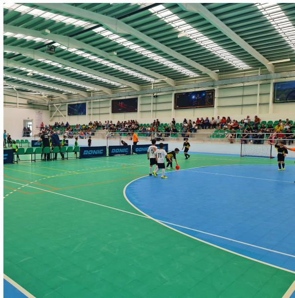
■ Pavilhão Municipal de Nespereira recebeu cerca de 125 atletas