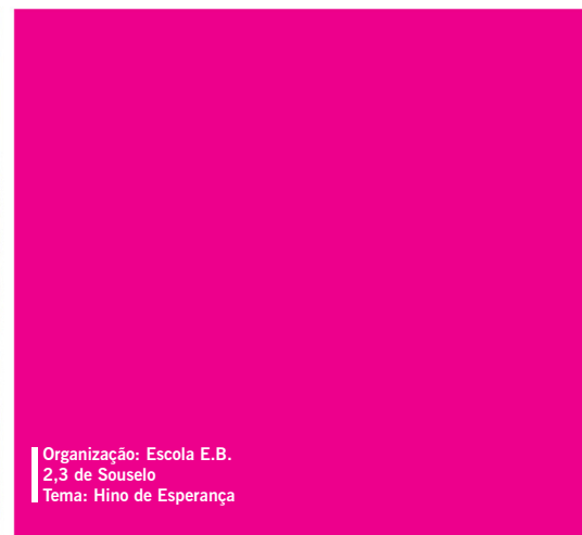
Organização: Escola E.B. 2,3 de Souselo Tema: Hino de Esperança