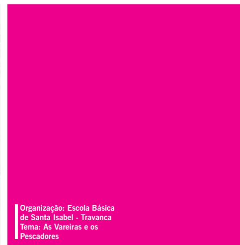
Organização: Escola Básica de Santa Isabel - Travanca Tema: As Vareiras e os Pescadores