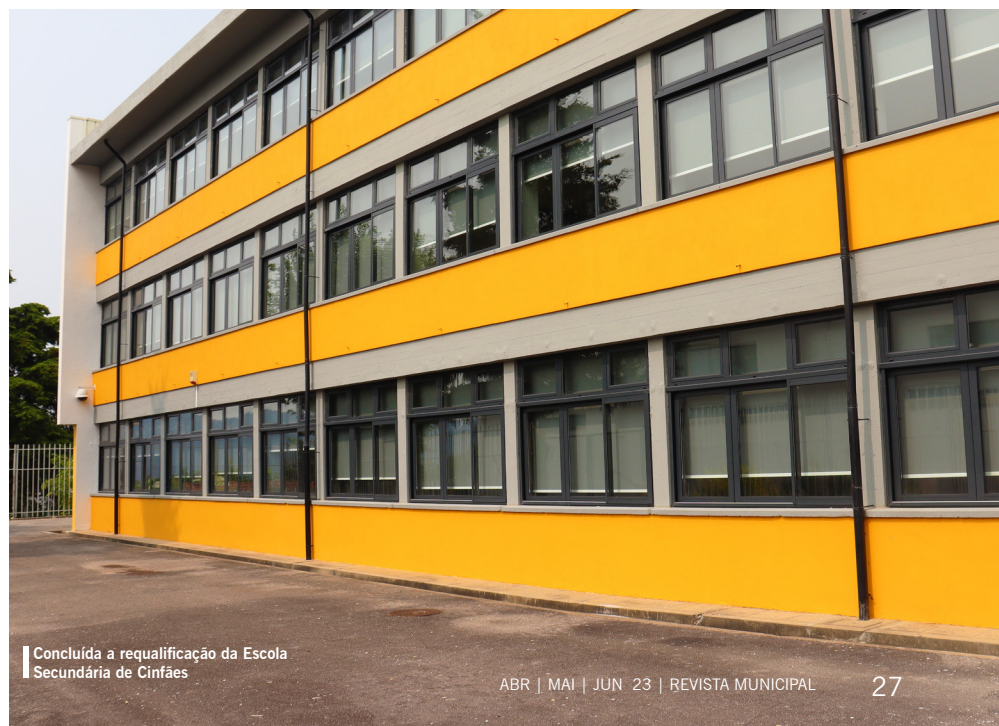
Concluída a requalificação da Escola Secundária de Cinfães